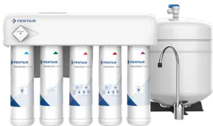
GRO-575M, [Comprend le contrôleur de MDT]