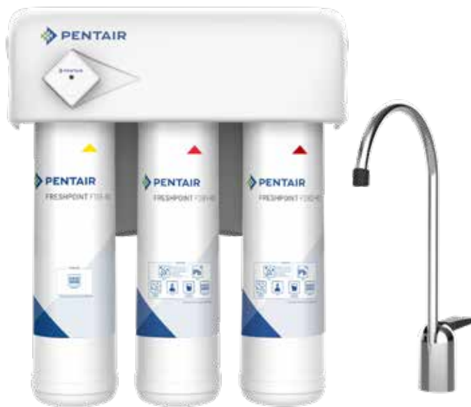
F3000-B2M, (Comprend le contrôleur de durée de vie du filtre illustré)